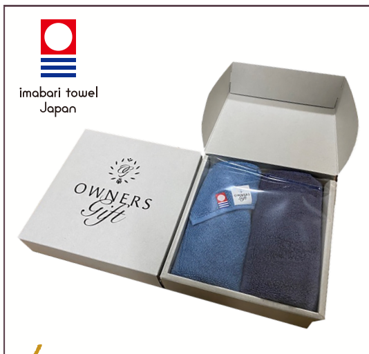
1 高級今治ハンドタオル (2枚入)