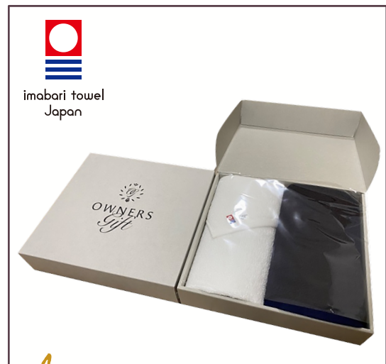
2 高級今治フェイスタオル (2枚入)