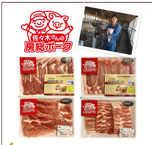
3 佐々木さんちの房総ポーク (1kg)